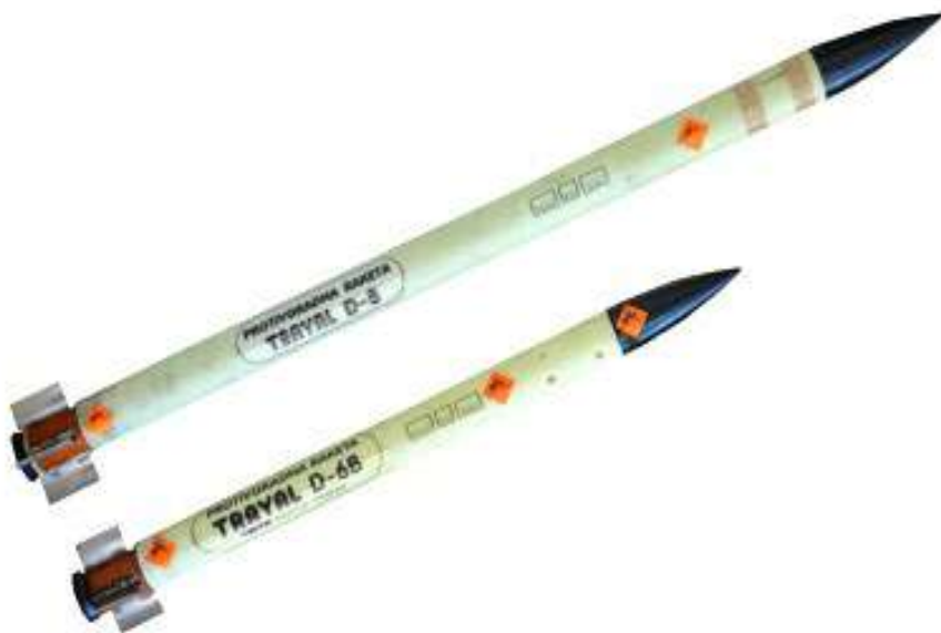
მოკლე და საშუალო რადიუსის მქონე მცირეგაბარიტიანი რაკეტები ტრავალი დ-6 და დ-8.

თანამედროვე სეტყვასაწინააღმდეგო რაკეტები ხასიათდება სხვადასხვანაირი კონსტრუქციით. ისინი ერთ ან ორ საფეხურიანია ან ორრეჟიმიანია. რიგ მათგანს ახასიათებს გამშვების დინამიური მეთოდი - გამშვებისას სპეციალური გამოსაგდები მუხტი ანიჭებს რაკეტას იმპულსს, რომლის დახმარებით რაკეტა დანადგარიდან გარკვეული საწყისი სიჩქარით (20 – 110 მ/წმ) გამოდის, რაც მიწისპირა ქარის გავლენას ამცირებს და ზრდის რაკეტის სიზუსტეს. ამ მიზნით გამოიყენება აგრეთვე სტაბილიზატორები და სპეციალური საქშენები, რომლებიც საშუალებას აძლევენ რაკეტას იბრუნოს თავის ღერძის მიმართ დიდი სიჩქარით. აქტიური ბოლის კოჭის აალება ხდება ელექტრონული ან პიროტექნიკური შემანელებელის საშუალებით. აღმოსავლეთ ევროპის რამდენიმე ქვეყანაში აწარმოებენ მაკედონური „მტტ-9მ“ ტიპის რაკეტის მოდერნიზირებულ ვარიანტებს, რომლებიც განსხვავდებიან სიგრძით, წონით, დასაკეცი სტაბილიზატორების კონსტრუქციით, რეაგენტის აქტივობით და ა.შ. მაგრამ ყველა მათგანი ერთი დიამეტრის და სქემისაა და მოთავსებულია სატრანსპორტო-გამშვებ კონტეინერში [16].